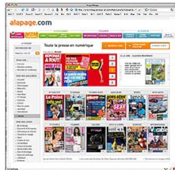
A la Page